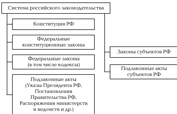
Схема 3. Система российского законодательства

щие нормы права. Их основная задача — конкретизировать и детализировать предписания законов. Характерными признаками является то, что они: