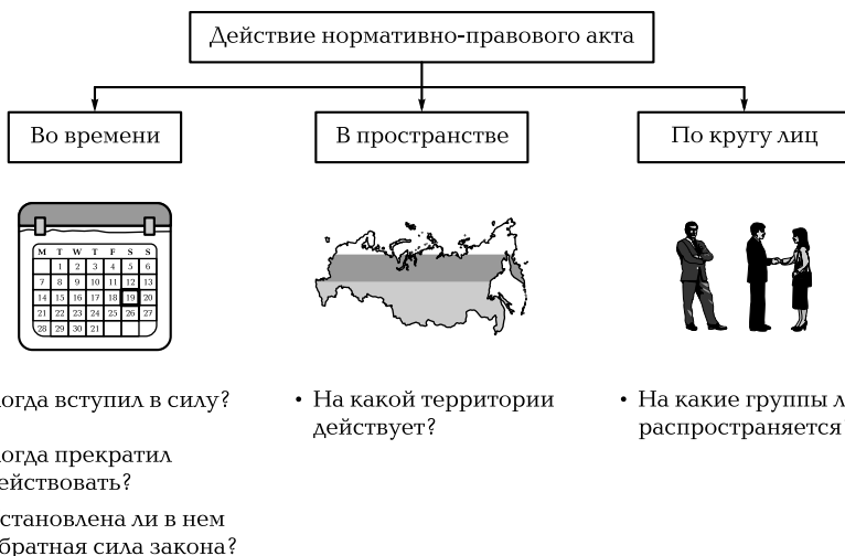
Схема 4. Действие нормативно-правовых актов

ющей территории, или лишь некоторых из них (ветеранов, пенсионеров, студентов, военнослужащих и т.п.). Однако из этого правила существуют исключения. Ряд законов распространяется только на граждан государства, они не действуют в отношении лиц без гражданства и иностранцев.