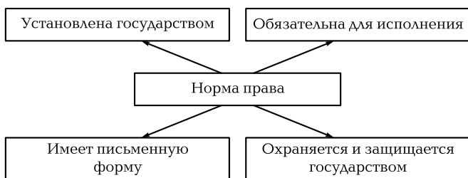
Схема 2. Признаки нормы права

3) являются результатом сознательно-волевой деятельности людей, т.е. возникают не случайно и не спонтанно, а выражают чью-то волю — конкретных людей, влиятельных в обществе социальных сил и групп, всего народа.