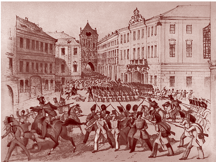
Столкновение восставших рабочих с войсками в Париже в июне 1848 г.

Бонапарт. В 1852 г. в результате совершенного ранее (декабрь 1851 г.) государственного переворота, установившего режим диктатуры, он стал императором Наполеоном III .