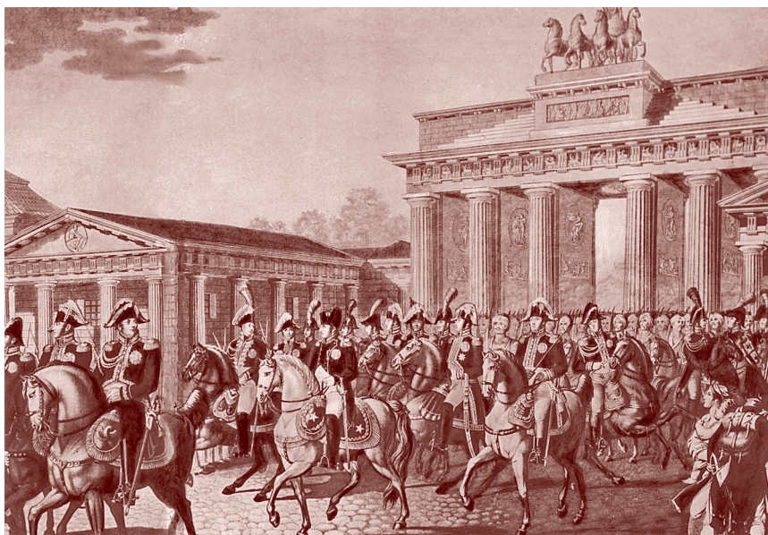
Вступление войск Наполеона в Берлин. 1807 г.

гих стран Европы попали в зависимость от Франции. Наполеон ликвидировал Священную Римскую империю. В Испании, Италии, Германии бразды правления перешли родственникам или приближенным Наполеона. С Россией, Австрией и Пруссией Франция заключила союзные договоры, хотя противоречия, особенно русско-французские, сохранялись.