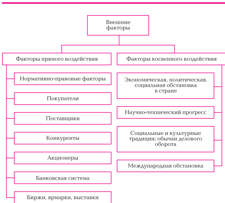
Рис. 1.2. Внешние факторы, оказывающие влияние на деятельность коммерческого предприятия

Существование и функционирование коммерческого предприятия зависит от покупателей . При этом следует иметь в виду обоюдное воздействие покупателей и предприятия. С одной стороны, покупатели создают спрос на определенные товары, торговое предприятие должно удовлетворять требованиям покупателей относительно ассортимента, цены и качества товаров. С другой стороны, предприятие само должно обеспечивать сбыт своих товаров (или услуг), используя для этого те же инструменты: ассортимент, качество товаров, качество обслуживания, уровень цен, а также рекламу и др.